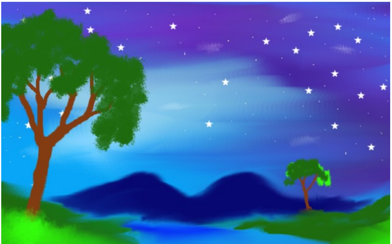
ARJUN 9 F LITTLE KITS STUDENTS