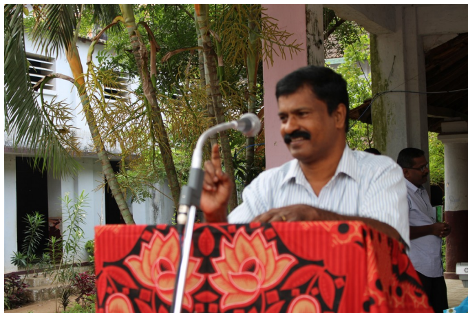
OUR SCHOOL STAFF SECRETARY