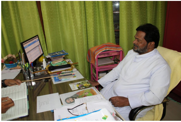
OUR SCHOOL HEADMASTER