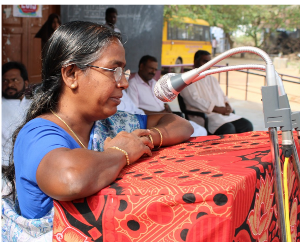
SCHOOL SENIOR STAFF