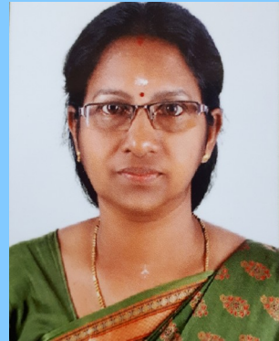
SHYLAJAR KITE MISTRESS