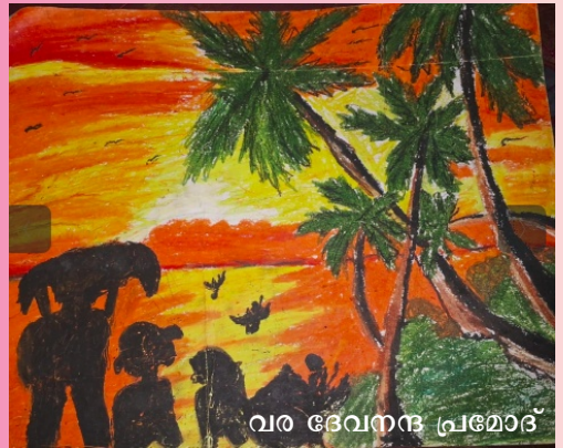
വര ദേവനന്ദ പ്രമോദ്