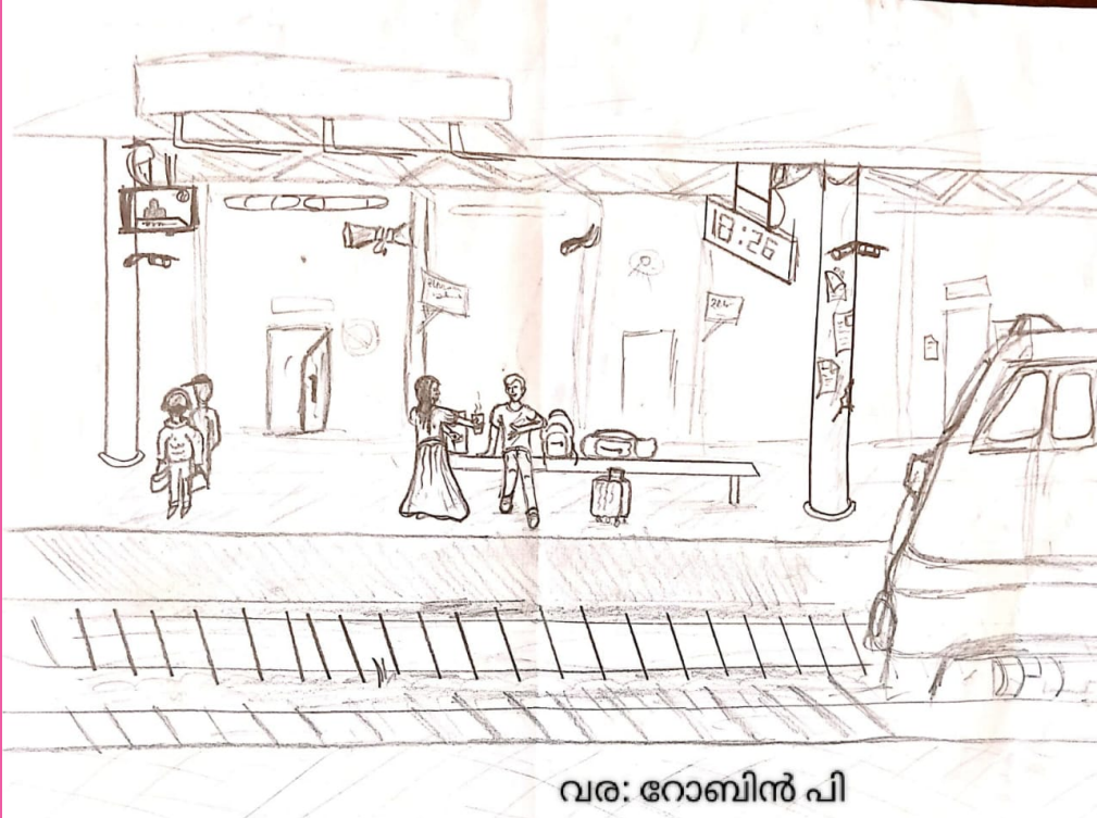
വര: റോബിൻ പി

വീട്ടിൽ ആയിരുന്നവെങ്കിൽ ഈ സമയത്ത് അമ്മ ചായയുമായി വന്നേനെ, ആ നേരത്താണ് അതുവഴി ഒരു പെൺകുട്ടി ചായയുമായി കടന്നുപോകുന്നത് കണ്ടത്. അവളെ പെട്ടെന്നു തന്നെ അടുത്തേക്ക് വിളിച്ചു. "ഹേയ് ഒരു ചായ" അവൾ അടുത്തേക്ക് വന്നു കൈയിൽ ഉണ്ടായിരുന്ന സമ്മോവറിൽ നിന്നും ഒരു ഗ്ലാസ്സ് ചായ പകർന്നു തന്നു.