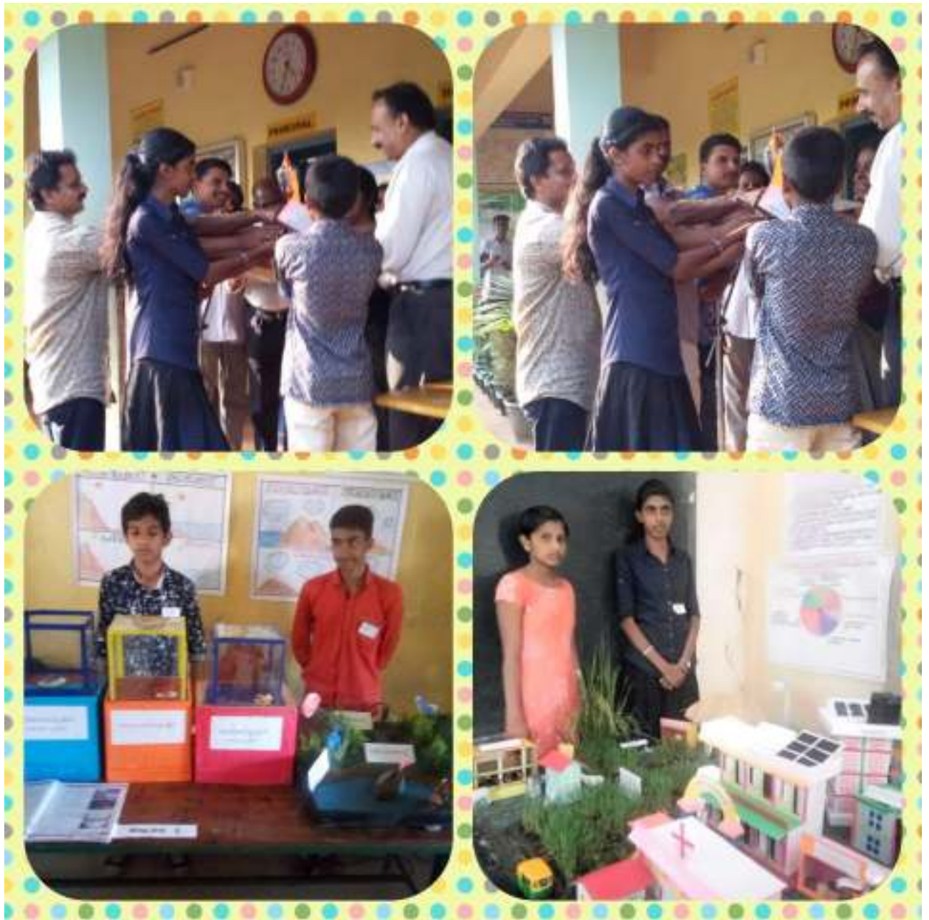
ഉപജില്ല സാമൂഹ്യ ശാസ്ത്ര മേളയിൽ ഓവറോൾ