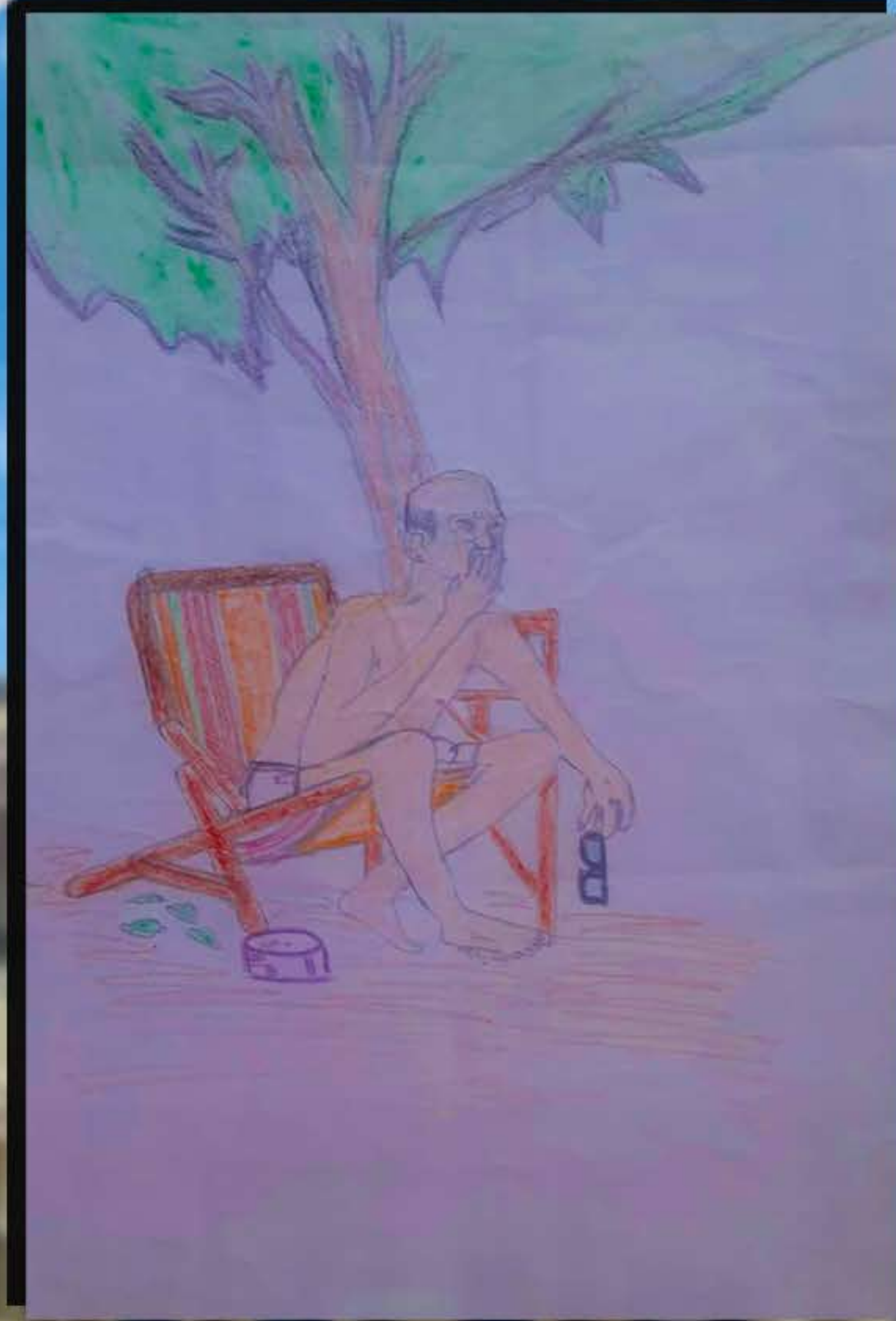
വരച്ചത് അഭിജിത് രാജ് 8A