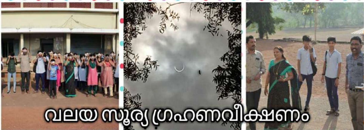
വലയ സൂര്യ ഗ്രഹണവീക്ഷണം