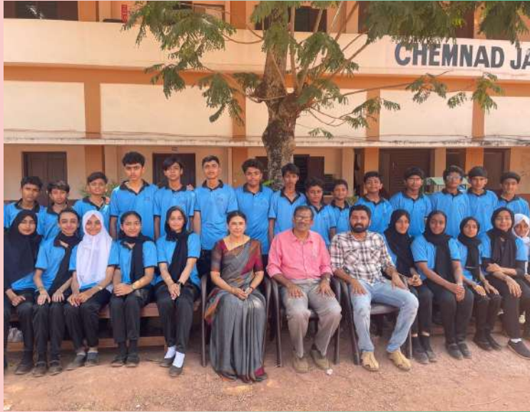
LITTLE KITES 2023-26 BATHCH