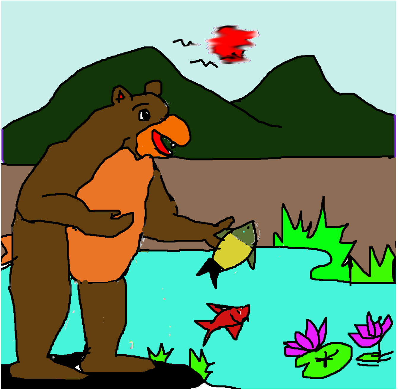
ആദ്യ ബാലകൃഷ്ണൻ 9 ഡി