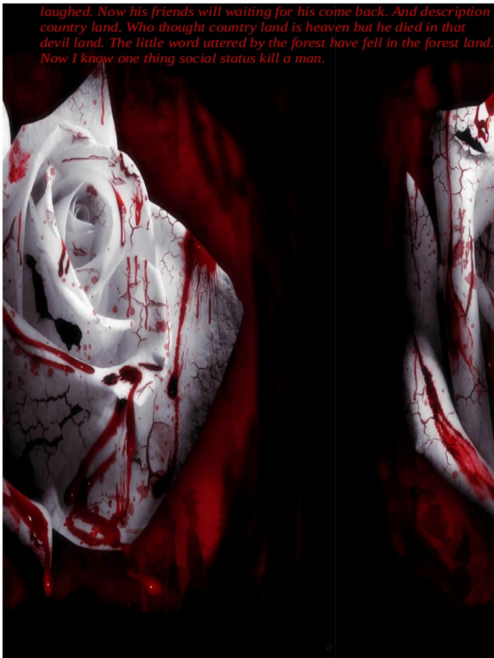
ലിനോൾഡ് മാത്യു 8 A