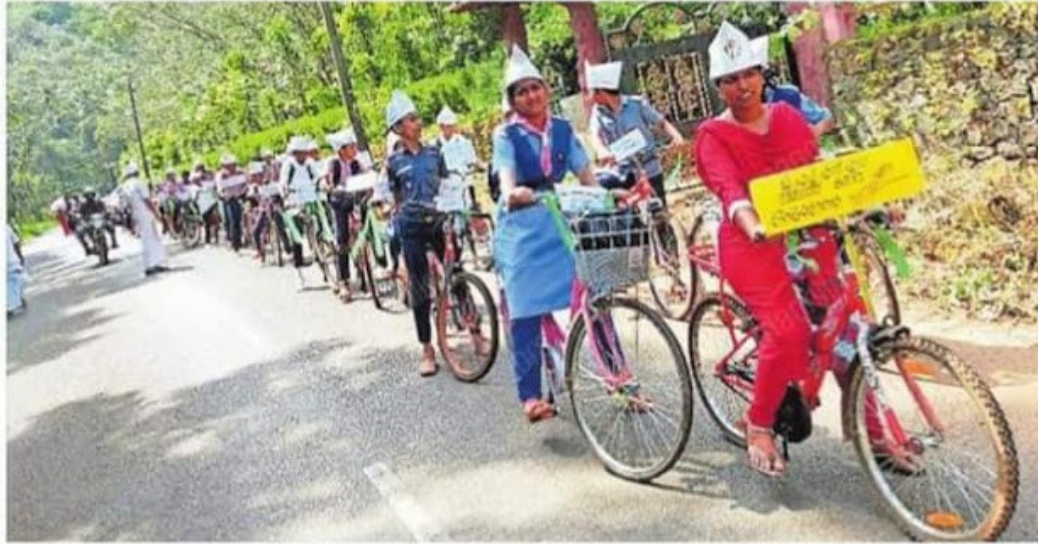
മാസോൺ ദിനാചരണത്തിന്റെ ഭാഗമായി മാലോത്ത് കസബ ഗവ. ഹയർ സെക്കന്ററി സ്കൂൾ വിദ്യാർത്ഥികൾ കൊന്നക്കാട് ടൗണിലേക്കു നടത്തിയ സൈക്കിൾ റാലി.