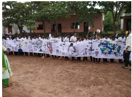
യുദ്ധവിരുദ്ധ റാലി- ഹിരോഷിമാ ദിനം