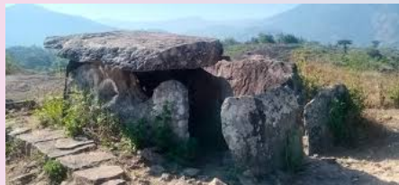
മറയൂരിൽ ജീപ്പ് സഹാരിക്കിറങ്ങി. ഓരോ ജീപ്പിൽ എട്ടുപേർ വീതം.

കൊണ്ട് പൊതിഞ്ഞതായിരുന്നു ആ നാട്. ഇടയിൽ കഞ്ഞു കഞ്ഞു വീടുകൾ, തേയില തോട്ടത്തിൽ പണിയെടുക്കുന്ന തൊഴിലാളികൾ. ഇതൊക്കെ കാണുമ്പോൾ നമ്മുടെ (ഭൂമി ശരിക്കും എത്ര സുന്ദരമാണെന്ന് തോന്നും . (ഭൂമിയെ നശിപ്പിക്കുന്നത് നമ്മൾ മനുഷ്യർ തന്നെയാണ് എന്ന് എനിക്ക് തോന്നി .വലിയ പാറക്കഷണങ്ങൾ കൂട്ടി ഉണ്ടാക്കിയത് പോലുള്ള മലകളും അതിലൂടെ പൊട്ടിയൊലിക്കുന്ന വെള്ളവും മനസ്സിനെ തണുപ്പിക്കുന്ന കാഴ്ചയായിരുന്നു .തേയില തോട്ടത്തിന് അടുത്ത് നിന്ന് ഫോട്ടോ എടുക്കാൻ വേണ്ടി ബസ്സ് നിന്നു. ഫോട്ടോയൊക്കെ എടുത്ത് പോകാൻ നേരത്ത് കുറച്ച് ആളുകളുടെ കാലിൽ അട്ട പറ്റി പിടിച്ചത് കണ്ടു അതൊക്കെ അധ്യാപകർ എടുത്തുമാറ്റി മരുന്നുകൾ ഒക്കെ വച്ചു. ഞങ്ങളുടെ മേൽ അവർക്ക് നല്ലോണം കരുതൽ ഉണ്ടായിരുന്നു .അവർ നമുക്ക് പഴങ്ങൾ വാങ്ങിച്ചു തന്നും സ്നേഹിച്ചും സഹകരിക്കുന്നുണ്ടായിരുന്നു. ഉച്ചഭക്ഷണം കഴിക്കാൻ വേണ്ടി മൂന്നാറിൽ ഒരു ഹോട്ടലിൽ നിന്നു. നല്ല ബിരിയാണി കഴിച്ച്