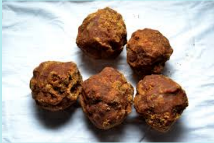
വിളയുന്ന ഏക സ്ഥലമാണ് കാന്തല്ലൂർ. റോഡ് മാർഗ്ഗം മാത്രമേ മറയൂരിലേക്ക് യാത്ര പറ്റൂ . താമസിക്കാൻ ധാരാളം

വന്യമൃഗസംരക്ഷണ കേന്ദ്രവും കണ്ണൻദേവൻ തേയിലത്തോട്ടങ്ങളും എല്ലാം കണ്ണമിഴിക്കുന്ന കാഴ്ചയാണ് . നാലുവശവും മലകളാൽ ചുറ്റപ്പെട്ടതാണ് മറയൂർ ഗ്രാമം. കേരളത്തിലെ മറ്റു പ്രദേശങ്ങളുമായി ഒരു സാമ്യവും ഇല്ലാത്തതാണ് ഈ മഴനിഴൽ താഴ്വര. കേരളത്തിൽ ആപ്പിൾ