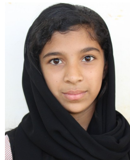
നസ്ല ഇ 8A