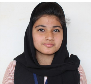
ഫഹ്മിത 10 A

പക്ഷേ യുവതലമുറയുടെ സഞ്ചാരം കേരളത്തിന്റെ തനി നശിപ്പിച്ചുകൊണ്ടിരിക്കുകയാണ്. ദ്രാന്താലയം എന്ന വിശേഷണം കേരളത്തിന് ലഭിക്കും തക്കവിധം യുവജനപ്രവർത്തനങ്ങൾ നീങ്ങിക്കൊണ്ടിരിക്കുകയാണ്.നാം ചിന്തിച്ച പ്രവർത്തനങ്ങളെല്ലാം നല്ലൊരു നാളെയെ നമ്മുക്ക് എന്നും നിലനിർത്താം.....ഇനിയുള്ള തലമുറക്കായി.