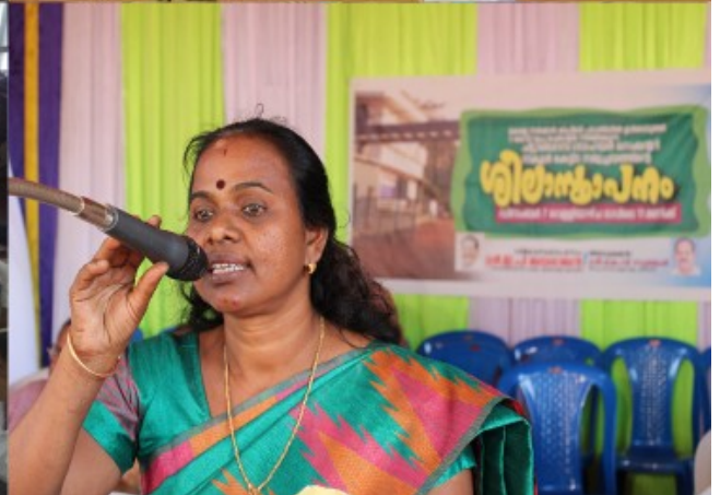
ലിറ്റിൽ കൈറ്റ്സ് ഗവ: ഹയർസെക്കന്ററി സ്കൂൾ ചിറ്റാരിപ്പറമ്പ്