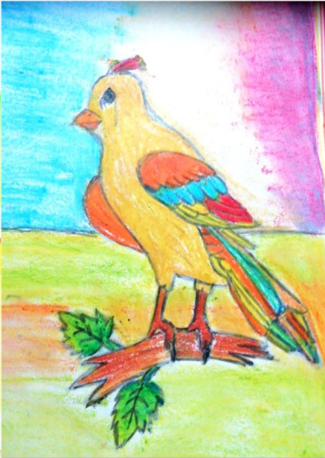
ലിറ്റിൽ കൈറ്റ്സ് ഗവഃ ഹയർസെക്കന്ററി സ്കൂൾ ചിറ്റാരിപ്പറമ്പ്