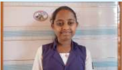
ദീക്ഷ . ബി 9B

ഇതാണ് ജി.വി.എച്ച്.എസ്. എസ് മുളേരിയ സ്കൂളിന്റെ ഇതുവരെയുള്ള ചരിത്രം