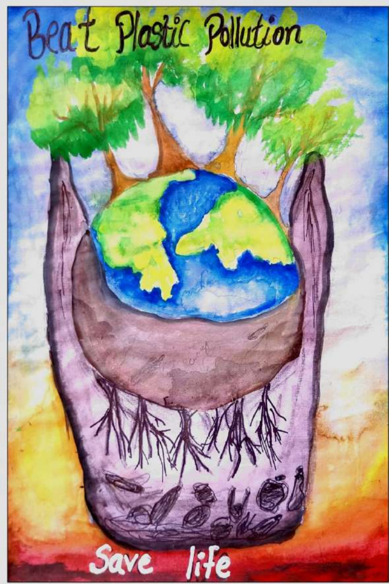
JIYA PRAKASH,6 B