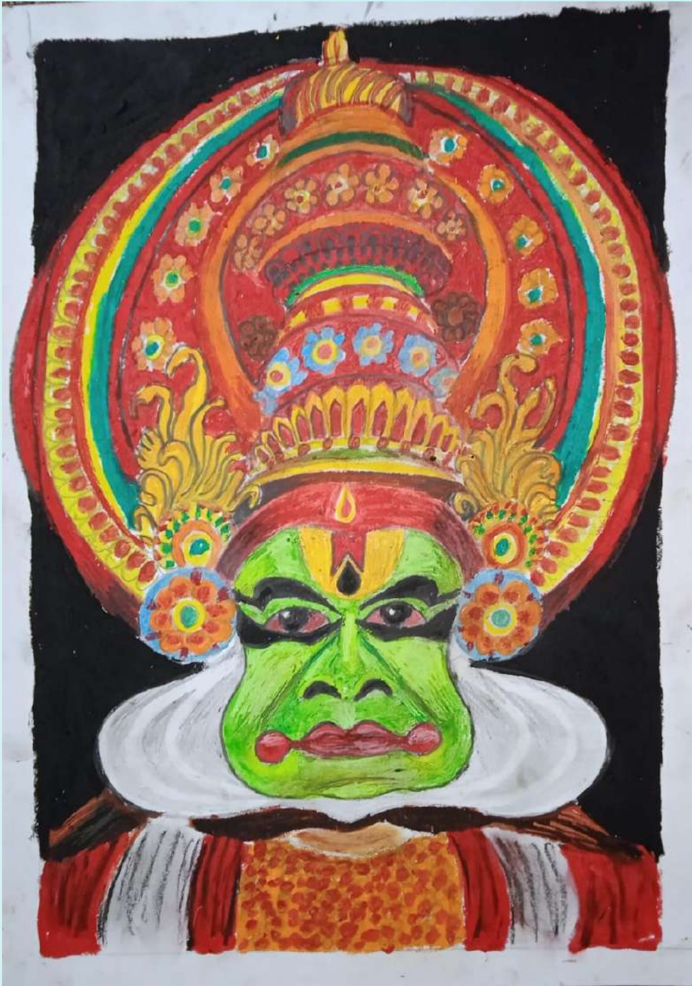
Vaishnav 9 B