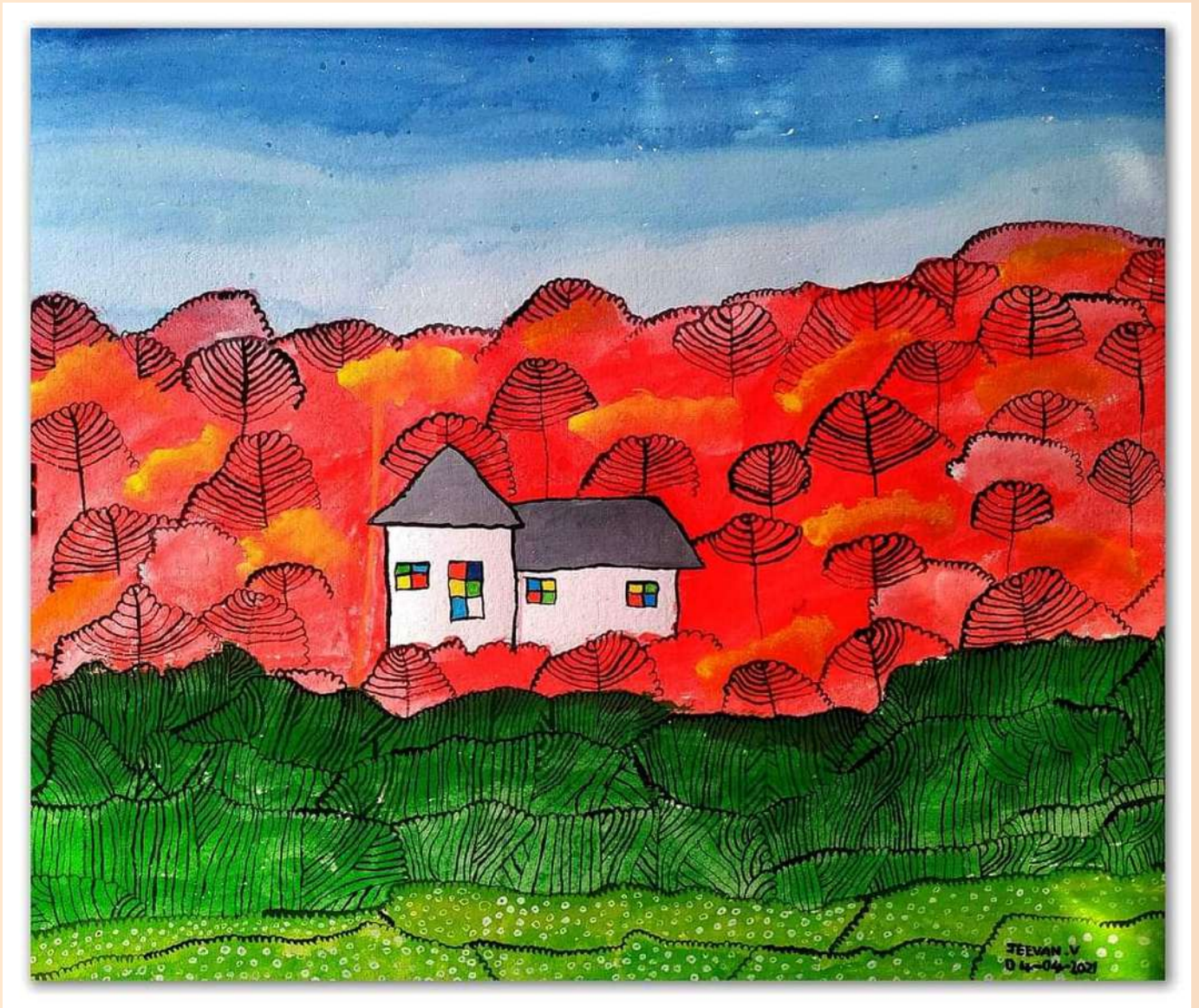
JEEVAN V,4 A