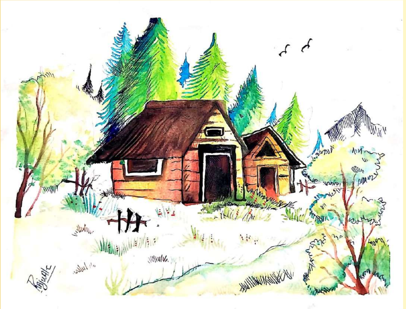
RAJWAL C ,5 A