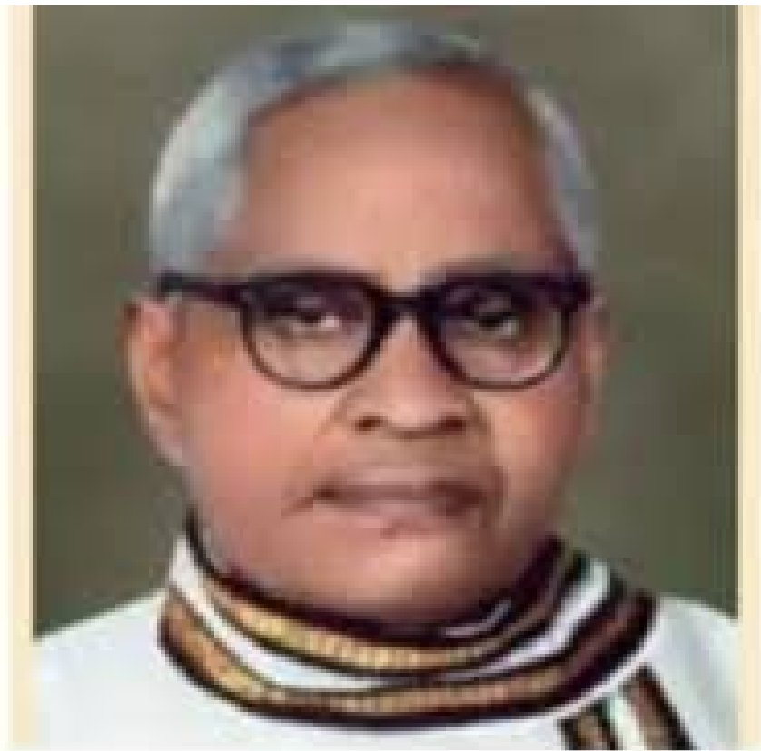
K. P. Kesava Menon – The great Independence activist

പൊന്നാനിക്കടുത്തുള്ള പന്നേരി നാലപ്പാട്ട് തറവാട്ടിൽ ജനനം. കവി, വിവർത്തകൻ എന്നി നിലകളിൽ പ്രശസ്തൻ. കണ്ണനിർതുളളി, പാവങ്ങൾ (വിവർത്തനം), ത്തിസാമ്രജ്യം, ചക്രവാളം, ആർഷജ്ഞാനം, സുലോചന തുടങ്ങിയവ പ്രധാന കൃതികൾ