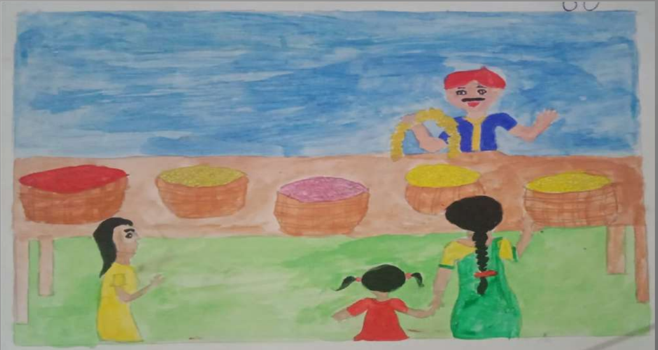
Absheera A 8B