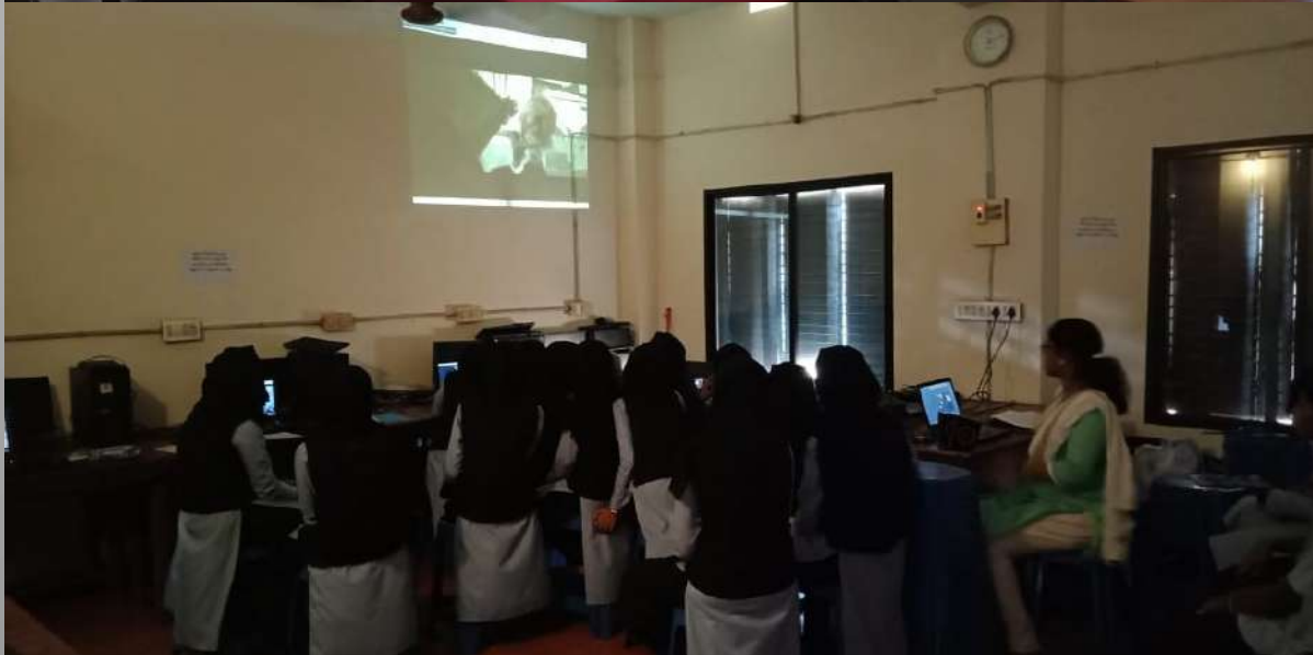
Little Kite Sub-district Participant